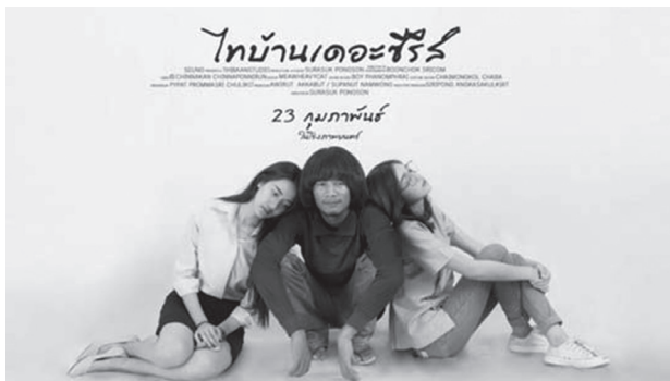
ภาพที่ 1 โปสเตอร์ของภาพยนตร์ไทบ้าน เดอะซีรีส์

ปี 2560 ที่ผ่านมา เป็นอีกหนึ่งปีที่วงการภาพยนตร์ไทยซบเซาโดยมีภาพยนตร์ไทยเข้าฉายในโรงภาพยนตร์จำนวน 40 เรื่อง และทำรายได้รวม 439 ล้านบาทและปรับลดลงอย่างต่อเนื่องจาก ปี 2559 มี 45 เรื่อง รายได้รวม 562 ล้านบาท และปี 2558 มี 55 เรื่องรายได้รวม 648 ล้านบาท (เช็คอากรหนังไทย ด่วน ! คุณดูหนังไทยเรื่องสุดท้ายเมื่อไหร่ ?, 2561) (Marketeer, 2018) แต่ภาพยนตร์ที่นับว่าสร้างปรากฏการณ์ปาล้อมเมืองให้กับวงการภาพยนตร์ในปีที่ผ่านมาคือ“ไทบ้าน เดอะซีรีส์” โดยทำรายได้กว่า 28 ล้านบาท จากงบประมาณในการสร้าง 2 ล้านบาท (ไทยรัฐ ออนไลน์, https://www.thairath.co.th/content/1036694 , 2560) (Thairat online, 2017) ได้รับความนิยมเป็นอย่างมากในกลุ่มผู้ชมภาพยนตร์ โดยเริ่มต้นฉายเฉพาะภาคอีสานก่อนแล้วเกิดกระแสตอบรับ จนกระทั่งบริษัทเมเจอร์ ซินีเพล็กซ์ กรุ๊ปและบริษัทเอสเอฟ ซีนีม่า ซึ่งเป็นเครือข่ายโรงภาพยนตร์ต้องนำเข้ามาฉายในกรุงเทพมหานคร เขตปริมณฑลและภาคอื่นๆ ในเวลาต่อมา