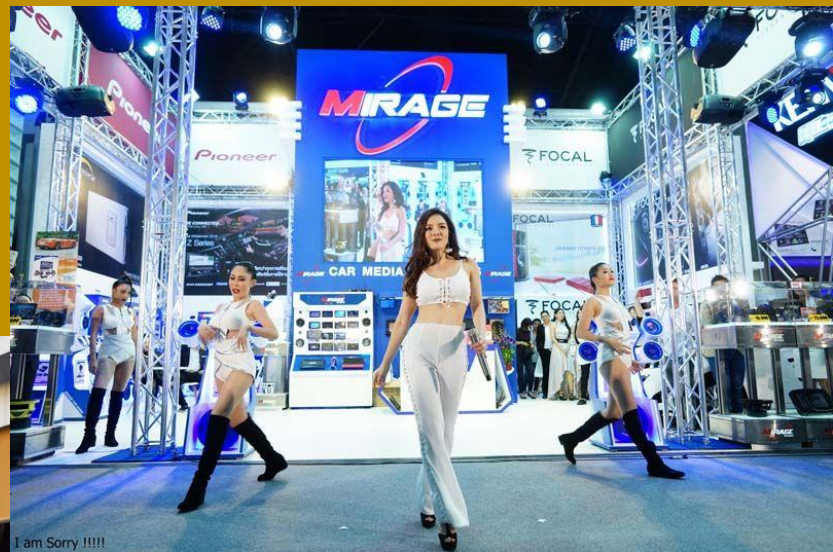
I am Sorry !!!!!