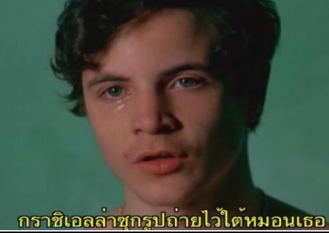
กราซีเอลล่าซุกรูปถ่ายไว้ได้หมอนเธอ