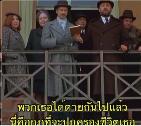
พวกเธอได้ตายกันไปแล้ว นี่คือภทที่จะปกครองชีวิตเธอ