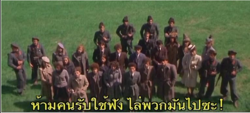
ห้ามคนรับใช้ฟัง ไล่พวกมันไปซะ!