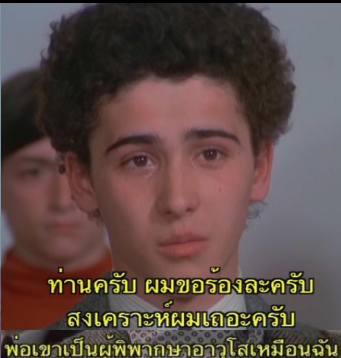
ท่านครับ ผมขอร้องละครับ สงเคราะห์ผมเถอะครับ พ่อเขาเป็นผู้พิพากษาอาวุโสเหมือนฉัน