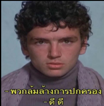
- พวกล้มล้างการปกครอง - ดี ดี