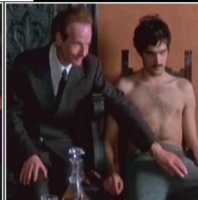
เหตุการณ์ ที่ 5