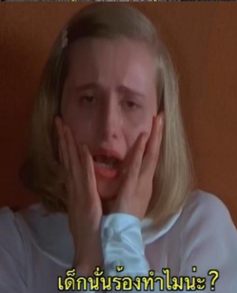
เด็กนั่นร้องทำไมนะ?