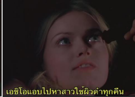
เอชิโอแอบไปหาสาวใช้ผิดตำทุกคืน