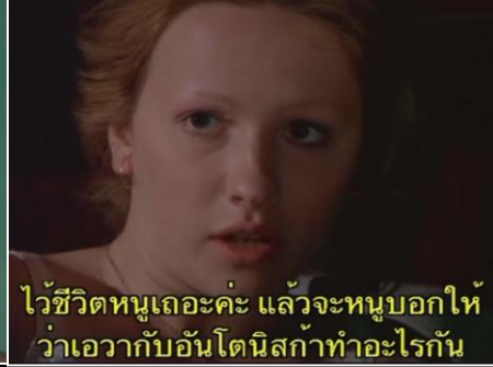
ไว้ชีวิตหนูเถอะค่ะ แล้วจะหนูบอกให้ ว่าเอวากับอันโตนิสกล้าทำอะไรกัน