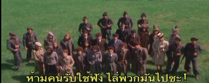
ห้ามคนรับใช้ฟัง ไล่พวกมันไปซะ!