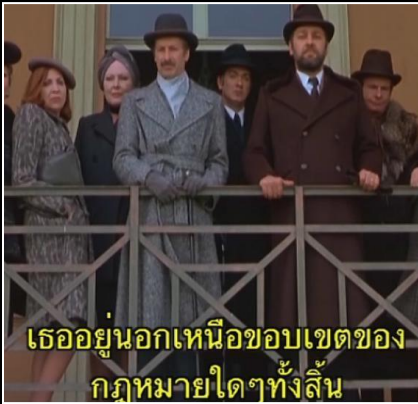
เธอยืนนอกเหนือขอบเขตของ กฎหมายใดๆทั้งสิ้น