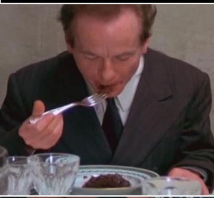
เหตุการณ์ ที่ 4