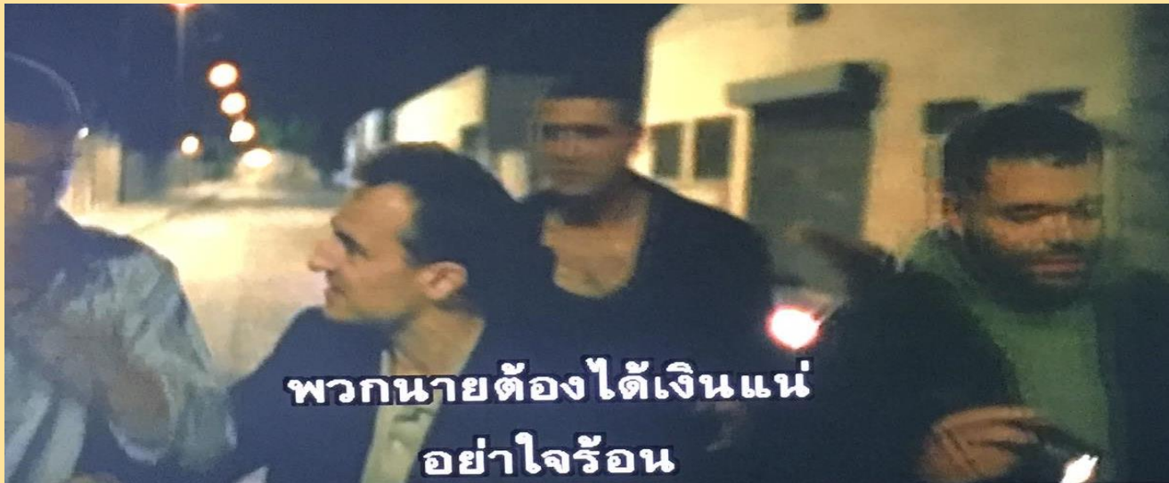
พวกนายต้องได้เงินแน่ อย่าใจร้อน