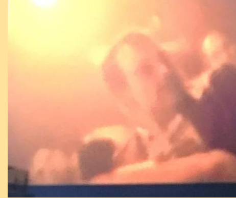
เดี๋ยวจ่า มีคนได้รับบาดเจ็บด้วย