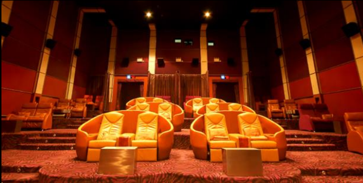
Bangkok Airway Blue Ribbon Screen – Paragon Cineplex